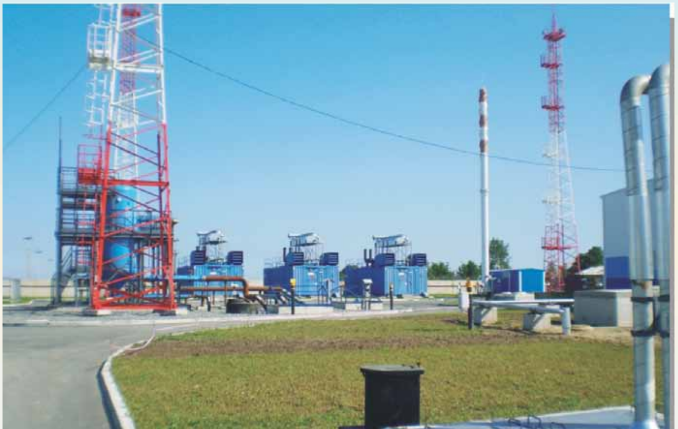
Водорассольный комплекс ПХГ п.Романово, Калининградская обл.