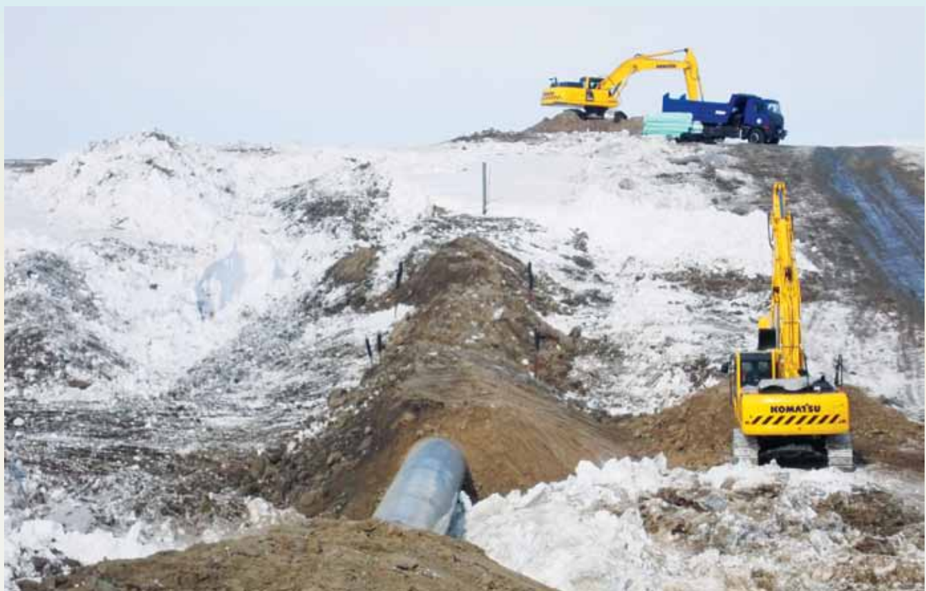
Система магистральных газопроводов Бованенково-Ухта.