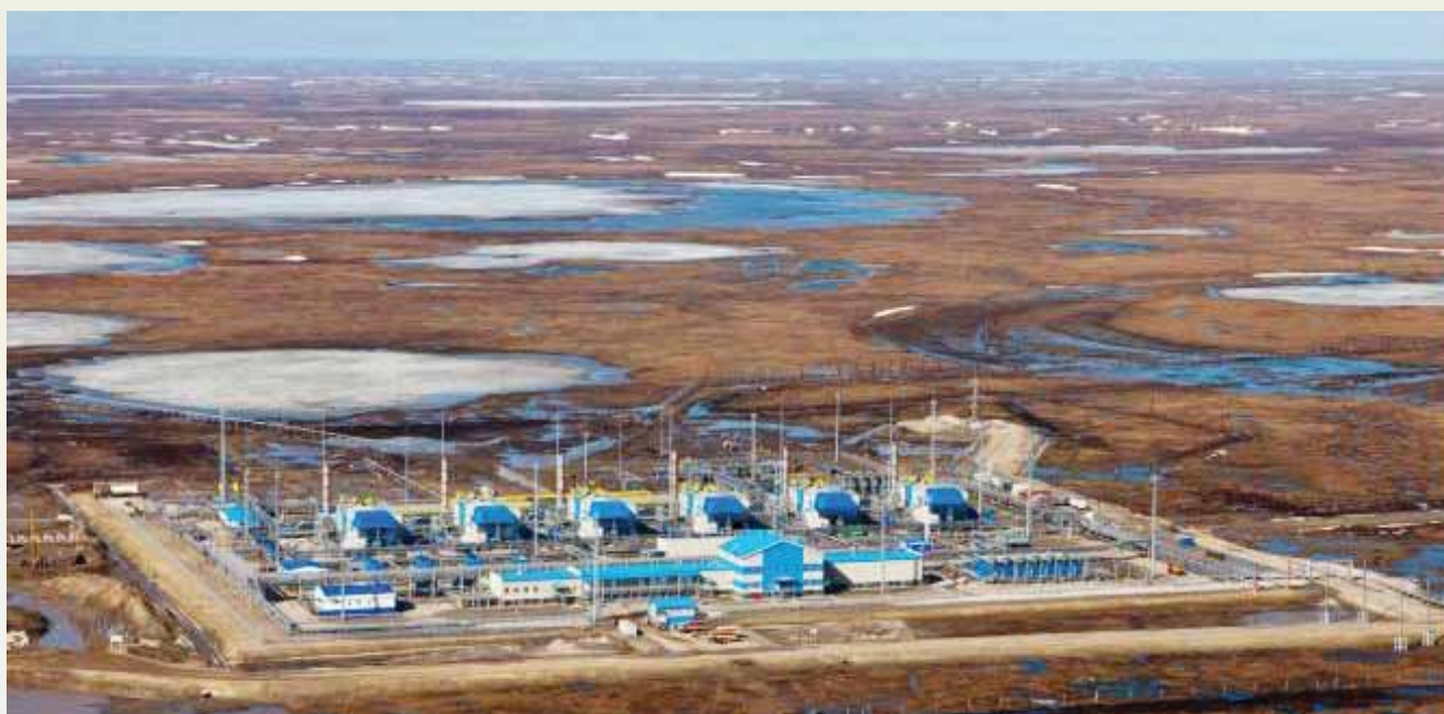
Компрессорная станция «Байдарацкая-2»