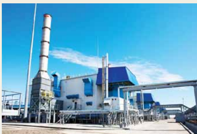
Компрессорная станция «Байдарацкая»