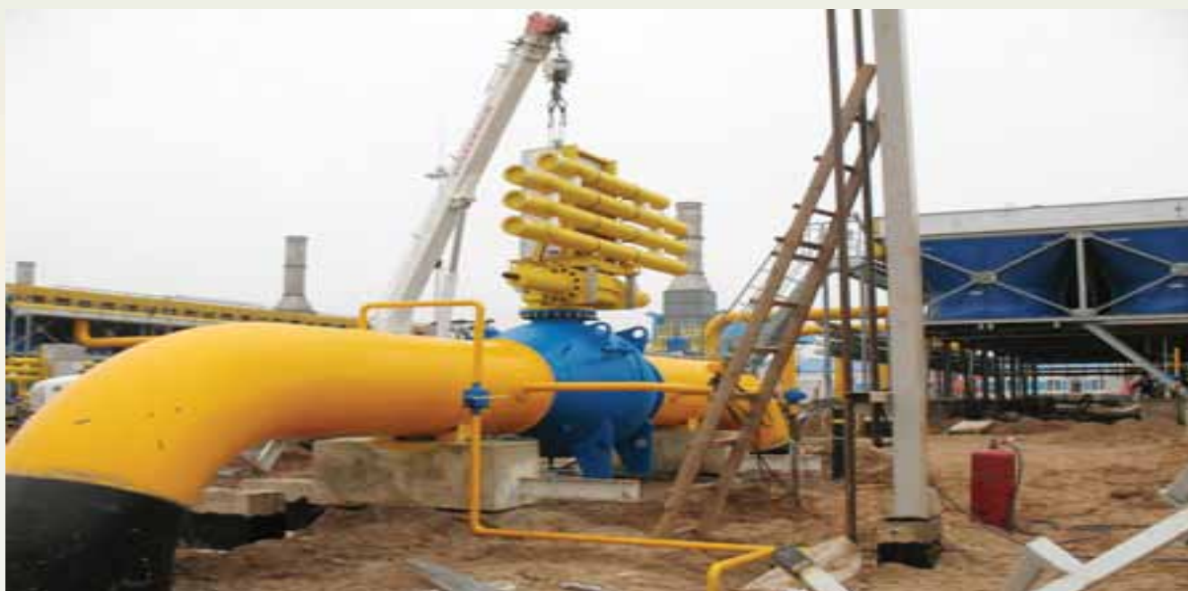
Компрессорная станция «Волховская-2»