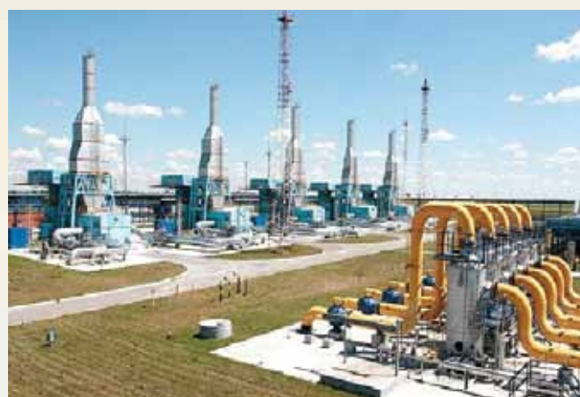
Компрессорная станция «Волховская»